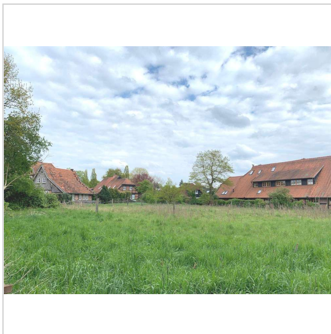
Grundstück mit Weide