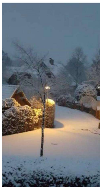
Impressionen im Winter